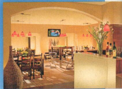
HÜBSCH, INNEN WIE AUSSEN Neun tolle Spielbahnen, quasi mitten in Wien und weitere Spielmöglichkeiten am Richardhof (o.) und in Loipersdorf – ein feines Angebot des C&C GC Am Wienerberg

Runden zu drehen. Vice versa gilt das natürlich auch für alle Vollmitglieder am Richardhof! Praktisch, wenn man gerne in der Steiermark auf Urlaub ist. Wer sich also für eine Mitgliedschaft am Wienerberg oder Richardhof entscheidet, darf sich nun über insgesamt 45 Loch Golfvergnügen freuen. Wer sich schnell entscheidet, kann seine Golfkunden im Altweibersommer kostengünstig, ja sogar gratis genießen: Alle, die sich jetzt eine Vollmitgliedschaft um 1.545 Euro (pro Jahr) am City & Countryclub Am Wienerberg gönnen, spielen den Rest der Saison 2013 gratis auf den drei Anlagen. Klingt doch mal ganz vernünftig. www.cityandcountry.eu