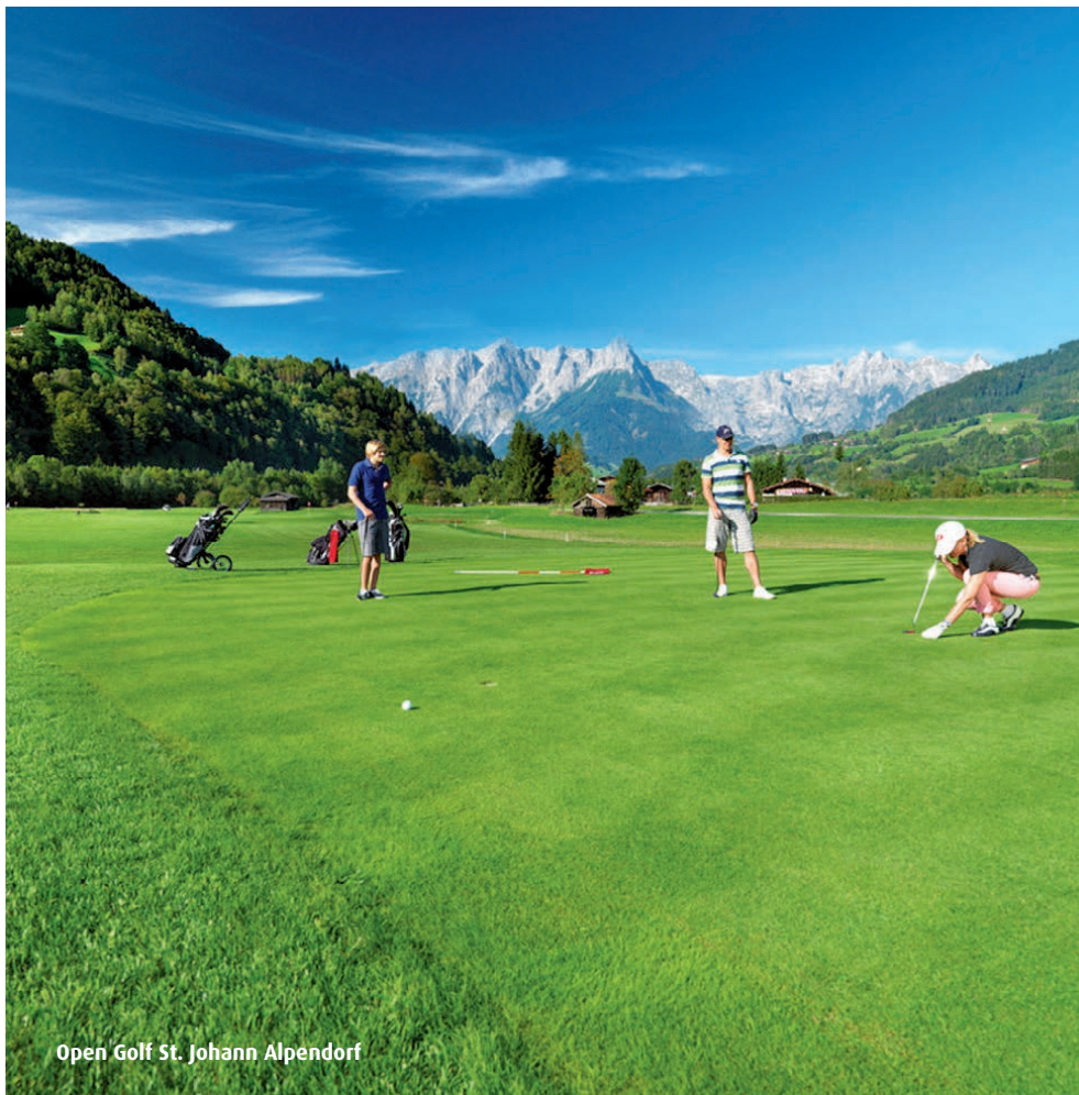
Open Golf St. Johann Alpendorf