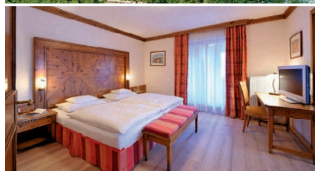
Hotel Oberforstthof, Zimmer