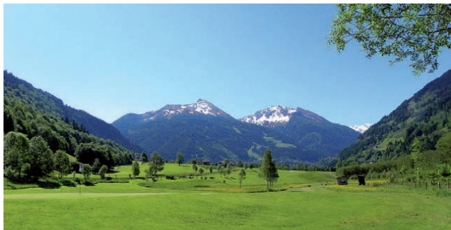
GC Gastein (37 km – 35 Minuten) – T 06434 2775, www.golfclub-gastein.com