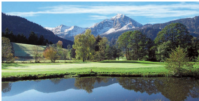
GC Goldegg (14 km – 20 Minuten) – T 06415 8585, www.golfclub-goldegg.com