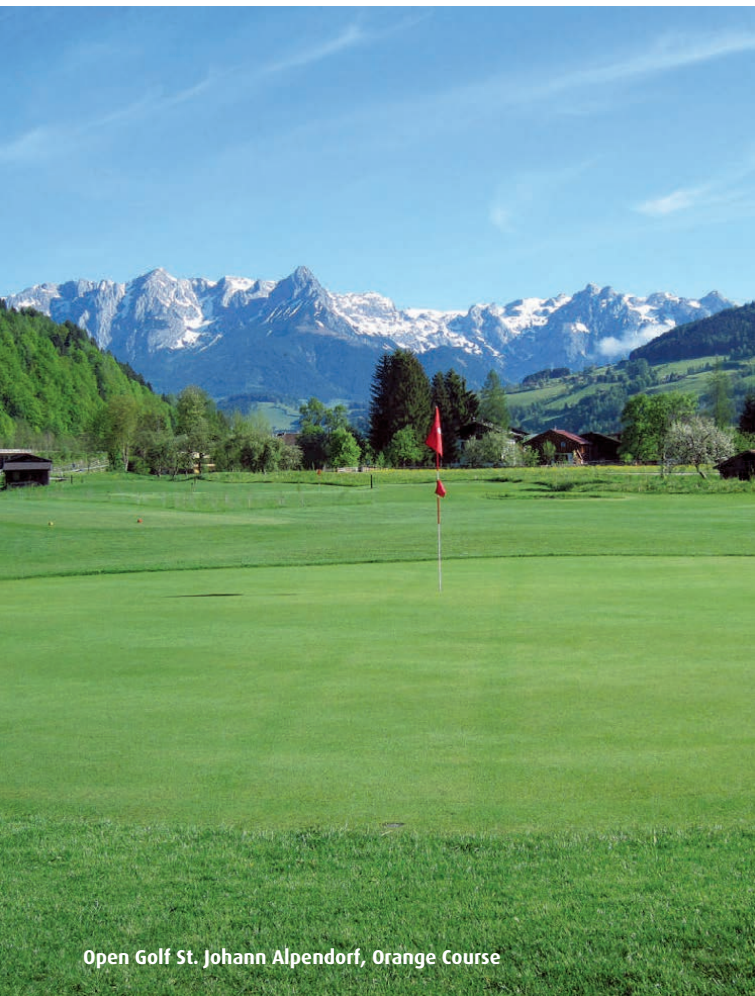
Open Golf St. Johann Alpendorf, Orange Course