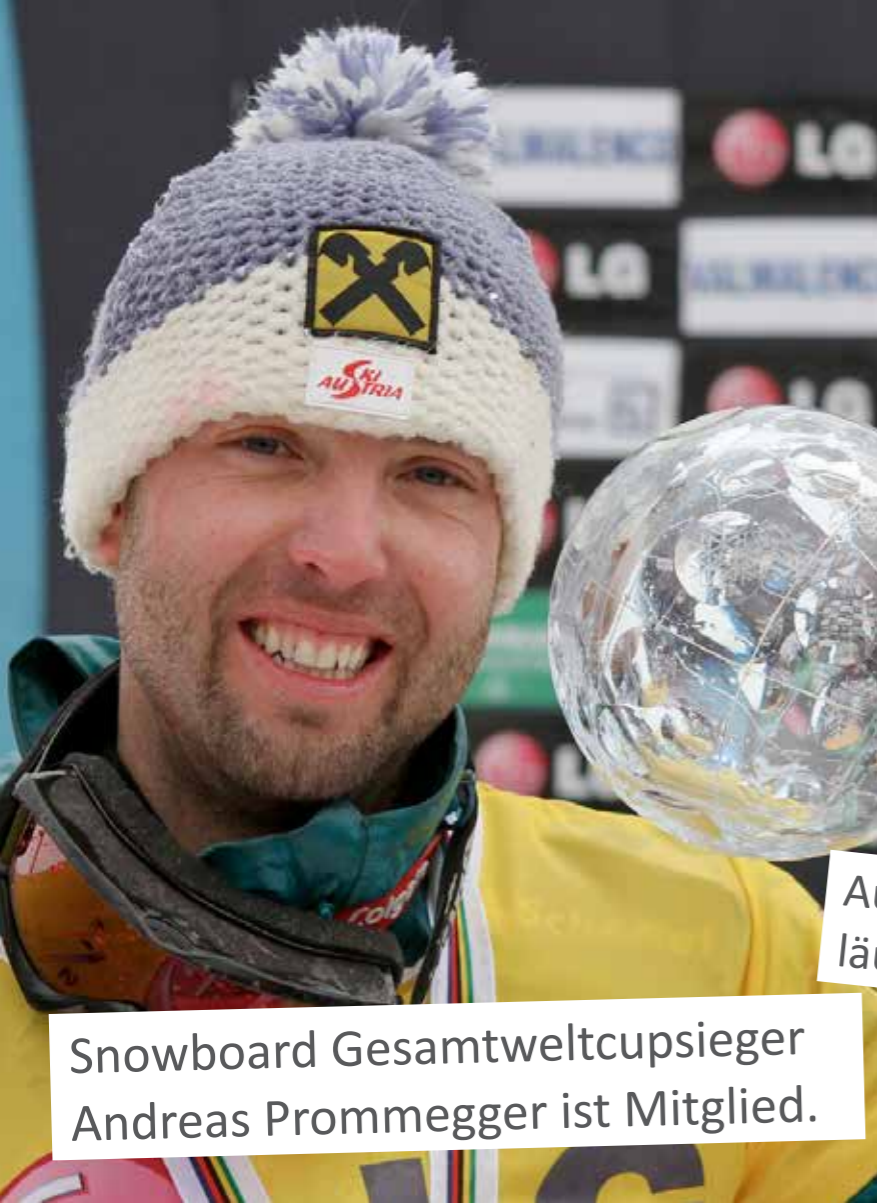
Snowboard Gesamtweltcupssieger Andreas Prommegger ist Mitglied.